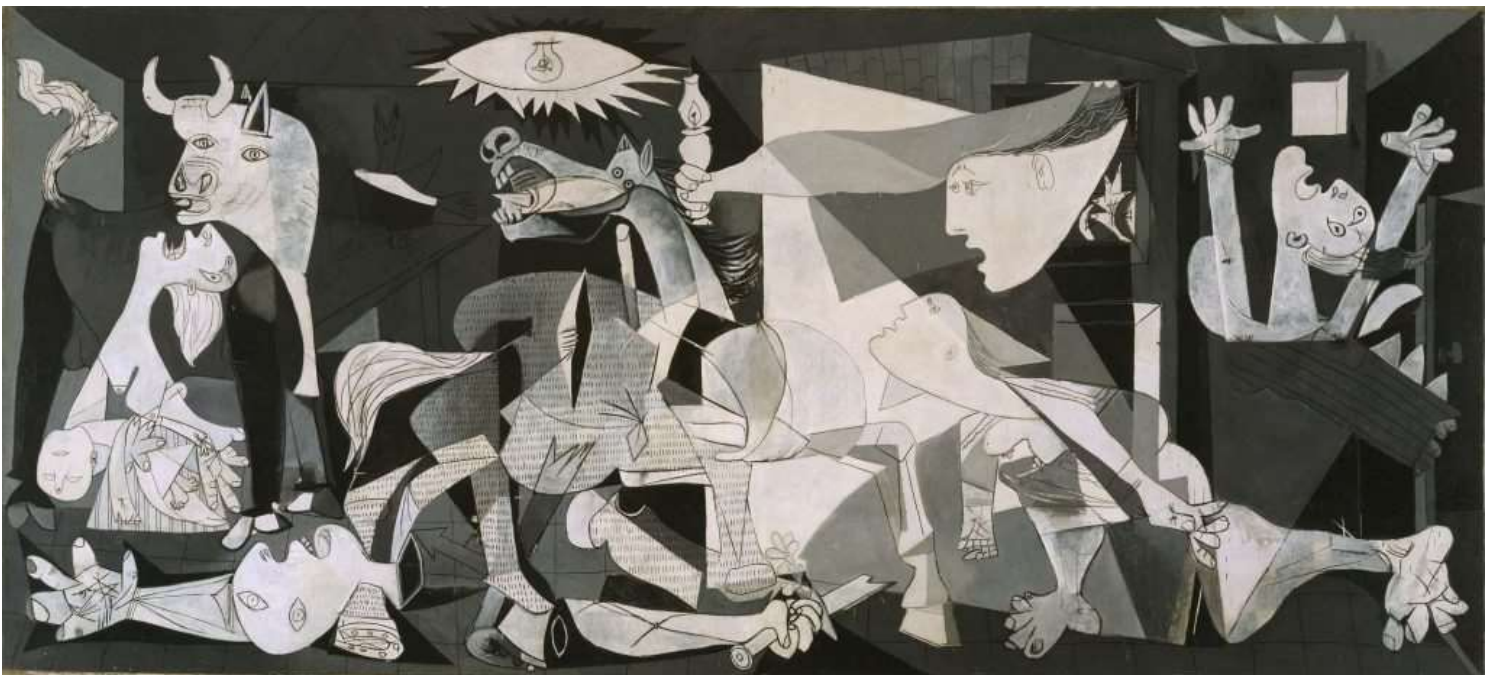
„Gernika“ – tai Pablo Pikasso paveikslas, nutapytas 1937 m. vokiečių lėktuvams subombardavus Ispanijos Šiaurėje esantį Gernikos miestą.