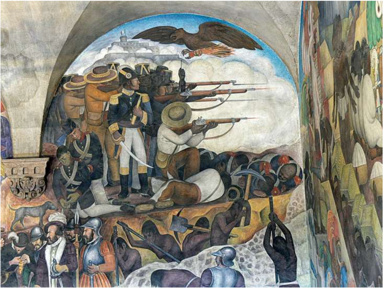
D. Rivera. Freskos Meksikos istorija (1929–35) fragmentas Nacionaliniuose rūmuose Meksike